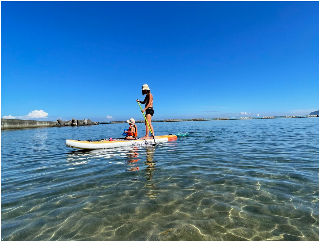
お子様とご利用も可能

プランの対象となる客室は、1名様から4名様までご利用いただけますので、お一人からファミリーでのご利用が可能です。。熱海パールスターホテルの客室は76平米以上の広さに全室自家源泉の温泉を完備しております。スポーツで心地よい疲れをお部屋の温泉でゆっくりと癒していただけます。夕食は中国料理「山海香味」。体を動かしたペコペコのお腹を本格中国料理のコースで満たしてください