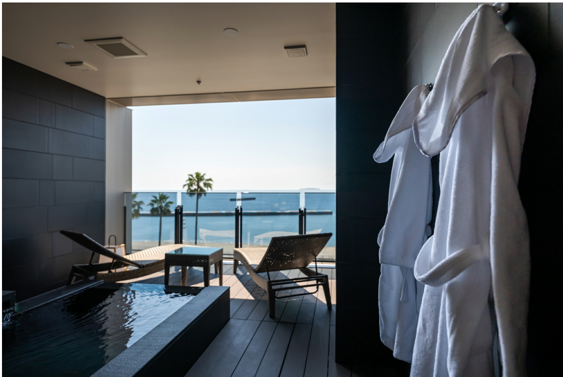
テラスに露天風呂のある客室キイメーヅ