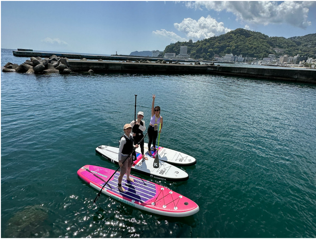
インストラクターのレクチャーのもとですぐにスタンドアップができます