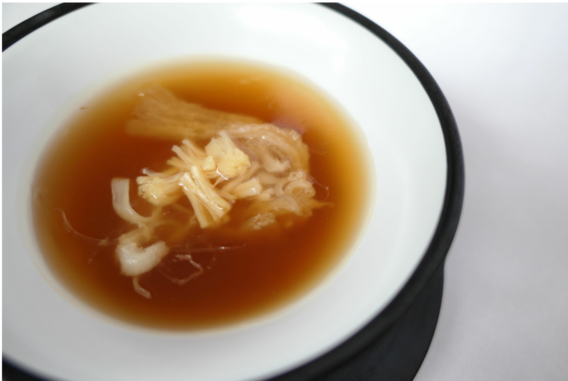
ふかひれと干し貝柱入りスープ