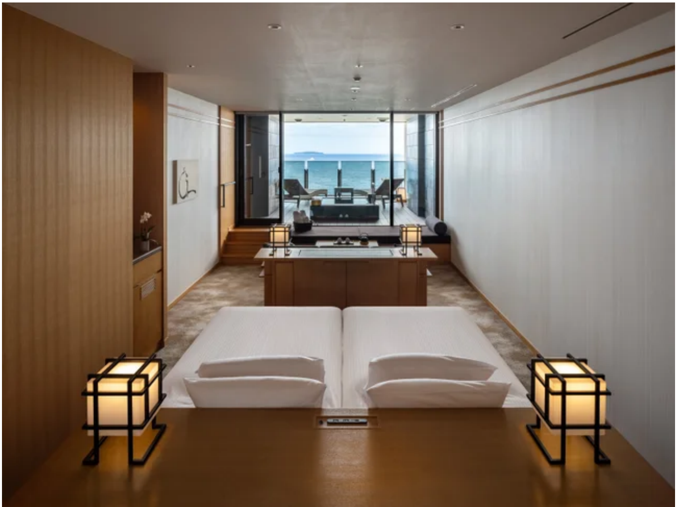
デラックスオーシャンビュー"ROTEN"の客室