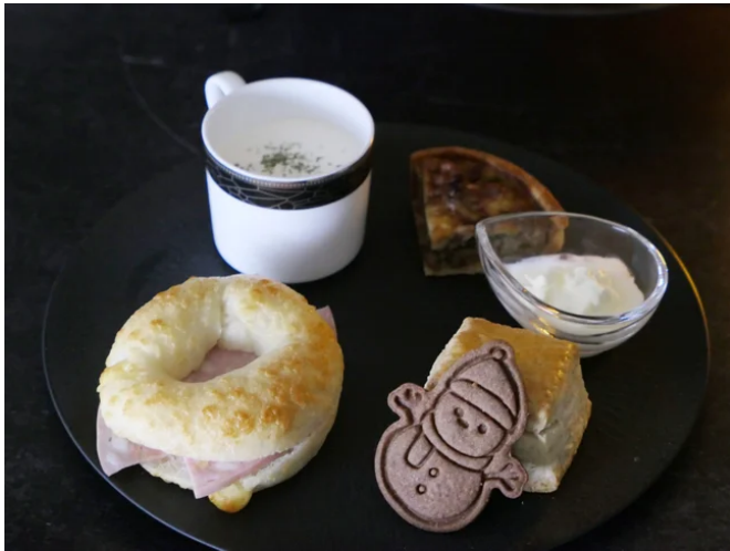
三段目 セイヴォリー4種