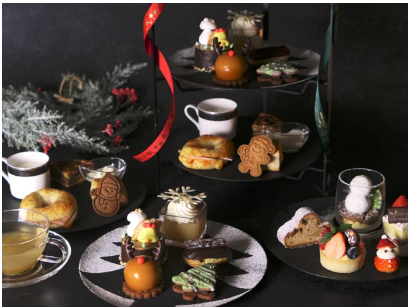
クリスマスアフタヌーンティー 2025

ショートケーキやベリータルト、スノーマン、エクレアなど聖夜を彩るスイーツが揃う「クリスマスアフタヌーンティー」を11/1～12/28限定で。華やかな冬の装いのラウンジで上質な時間をお愉しみください。