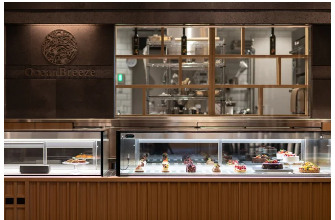
ラウンジ内 ペストリーショップ

上質な語らいをテーマにしたラウンジは、目の前の熱海サンビーチの賑わいからは全く想像もできない優雅さと静寂に満ちています。また伊豆特有の漆黒の溶岩石で作られた水盤には、季節ごとに花が生け入れられゲストをお迎えし、ホテルラウンジならではのエレガントなひとときをご堪能いただけます。契約農園で茶樹を育成し自社工場で製茶を行う地元静岡のクラフト紅茶「静岡紅茶」、ドイツの歴史ある紅茶メーカー「ロンネフェルトティー」などと共に、国内の名店で腕を磨いたパティシエがつくるスイーツと共に心落ち着くひと時をお過ごしください。