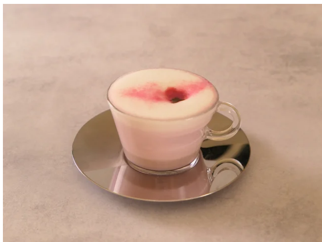
スペシャルティファーストドリンク 桜ラテ