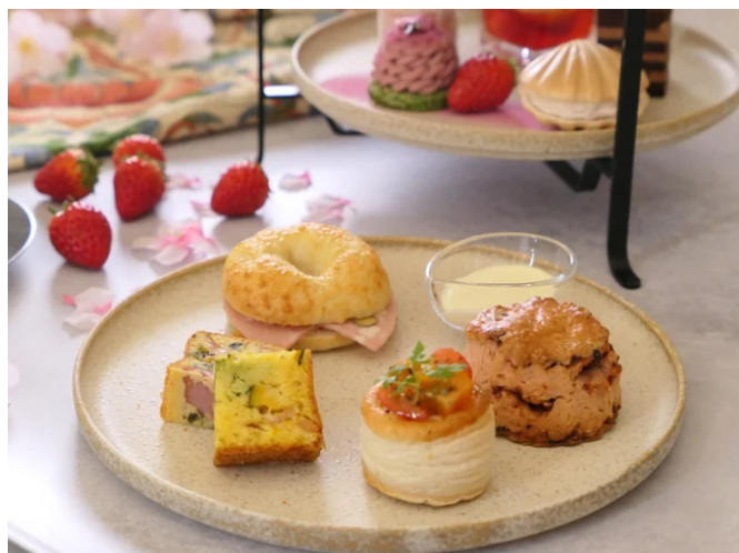
3段目 セイヴォリー

オーストラリアの伝統菓子として親しまれるラミントンを、いちごのやわらかな甘みで上品にアレンジ。しっとりとしたスポンジに繊細なココナッツを纏わせ、果実の香りと軽やかな食感が春の華やぎを添える一品です。