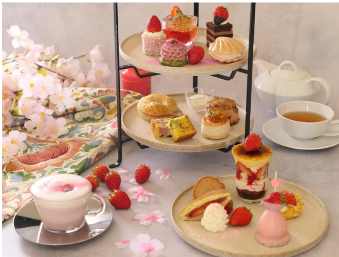
いちごと桜のアフタヌーンティー

静岡産「紅ほっぺ」を中心に、桜の香りや色合いを重ねた華やかなスイーツが並ぶ季節限定企画。冬の熱海で、一足早い春の訪れをお楽しみください。