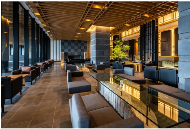
オーシャンブリーズ店内