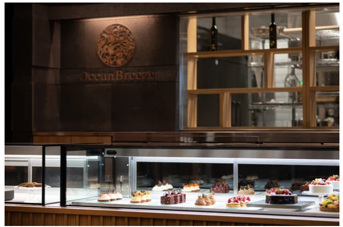
オーシャンブリーズケーキショップ

上質な語らいをテーマにしたラウンジは、目の前のビーチの賑わいからは全く想像もできない優雅さと静寂に満ちています。また伊豆特有の漆黒の溶岩石で作られた水盤には、季節ごとに花が生け入れられゲストをお迎えし、ホテルラウンジならではのエレガントなひとときをご堪能いただけます。契約農園で茶樹を育成し自社工場製茶を行う地元静岡のクラフト紅茶「静岡紅茶」、ドイツの歴史ある紅茶メーカー「ロンネフェルトティー」などと共に、国内の名店で腕を磨いたパティシエがつくるスイーツと共に心落ち着くひと時をお過ごしください。