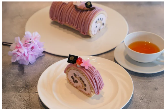
桜ロールケーキ（ケーキセット）イメージ

生地とシャンティに桜の香りと味を纏わせ、中央の大納言をアクセントにロールしました。ケーキの周りはモンブランクリームで繊細に仕上げています。