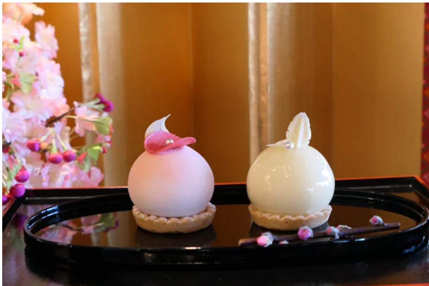
おひなさまケーキ

ひな人形飾りとおひなさまケーキセットは2024年4月3日までお楽しみいただけます。