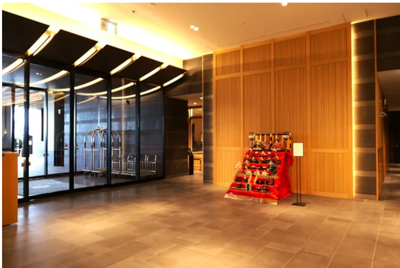
熱海市西部地区町内会連合会から寄贈いただいたおひなさま

ていることが多いようです。当ホテルではこの風習を尊び4月3日までおひなさまを展示いたします。