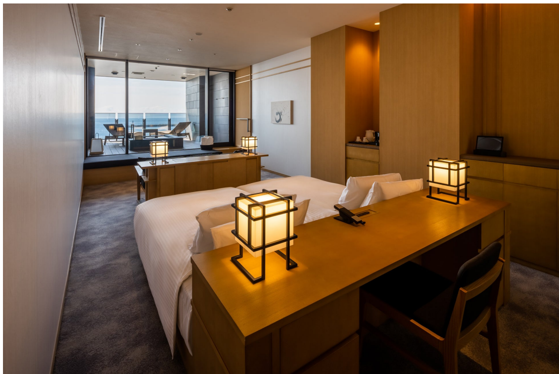
デラックスオーシャンビュー-ROTEN